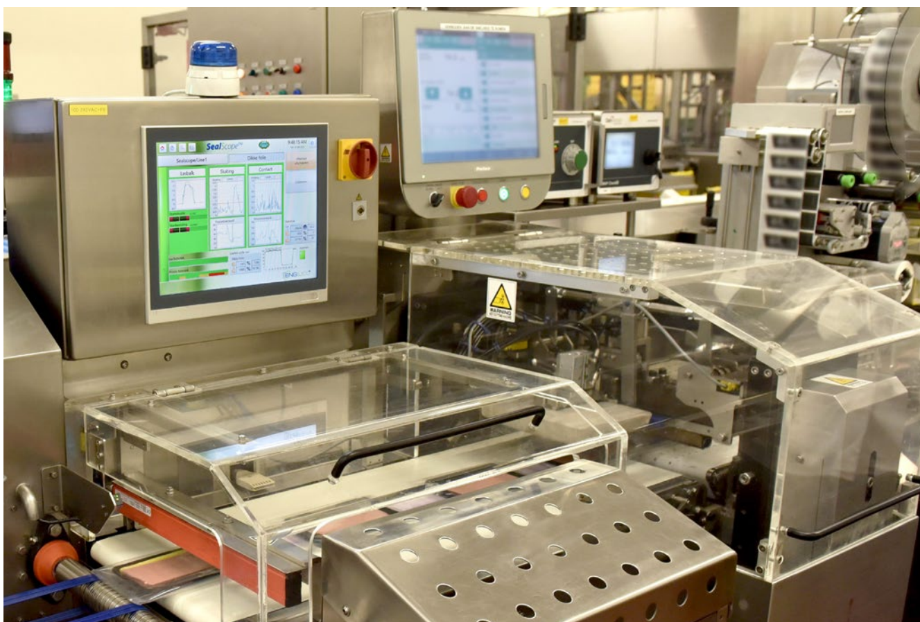
Le système SealScope™ permet une inspection à 100 % de l'étanchéité et révèle les tendances dans le processus d'emballage.

poursuit Jeroen De Spiegeleire du service technique. « Cela nous donne un niveau élevé de confiance dans le fait que chaque produit est inspecté individuellement. »