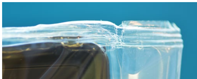
Emballages défectueux émis par le système SealScope™ avec plis (en haut) et emballage en plastique dans le joint (en bas).