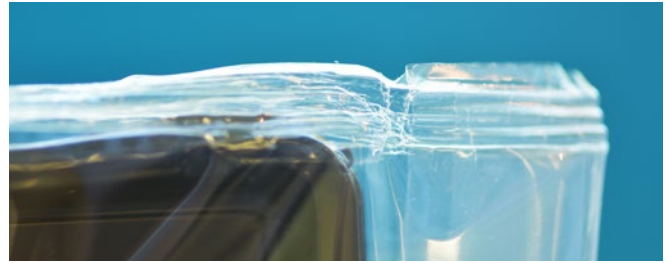
Verpakkingen met plooiën (boven) en schaalte in lasnaad (onder) uitgestoten door het SealScope™ systeem