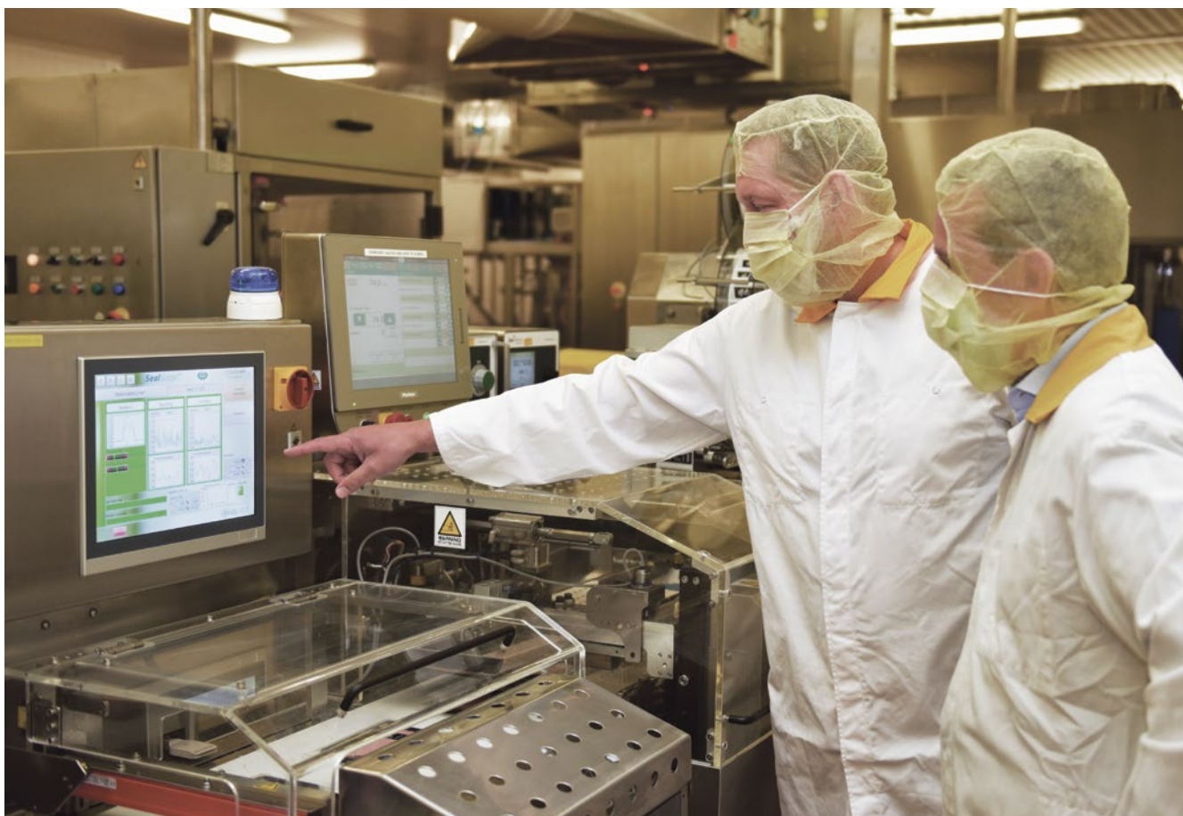
Het SealScope™ systeem levert 100% lasnaadinspectie en maakt eveneens trends in het verpakkingsproces zichtbaar

Het SealScope™ systeem is complementair aan de uitgebreide kwaliteitscontroles en systemen die De Spiegeleire voltijds inzet zoals gewichtscontrole, metaaldetectie en gas-en staalanalyse. Ook de leverancier van de verpakkingslijn is sterk onder de indruk, en meldt dat bij hun klanten, De Spiegeleire de productievestiging is met de meest doorgedreven kwaliteitscontrolesystemen.