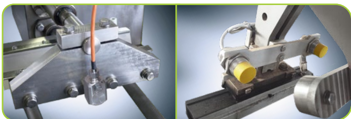
Capteurs sur les mâchoires de soudure