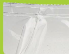
Plis dans la soudure