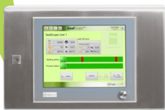
Tableau de commande avec écran tactile