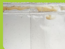
Produit dans la soudure