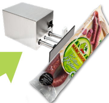
Système de rejet (**)