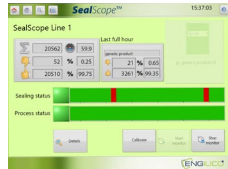
SealScope® écran de l'opérateur